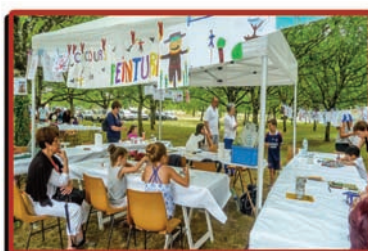
concours de peinture