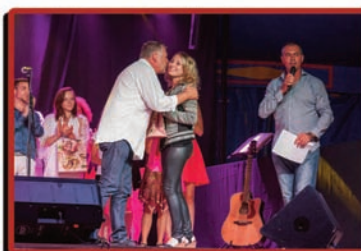
concours de la chanson