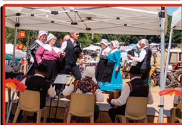
fête des battages