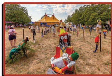
festival des épouvantails