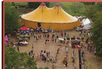
festival des épouvantails