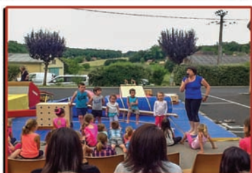
fête de la gym