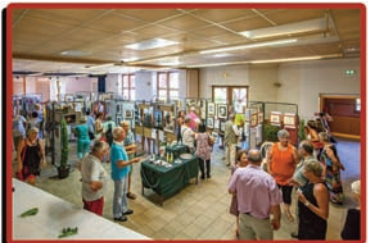
expo des artistes amateurs